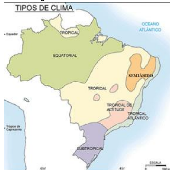
Regiões climáticas do Brasil

Semiárido – Ocorre no interior do Nordeste, na região conhecida como Polígono das Secas. Corresponde a quase todo o sertão nordestino e aos vales médio e inferior do rio São Francisco. Caracteriza-se por temperaturas elevadas (média de 27 °C) e chuvas escassas e mal distribuídas, em torno de 700 milímetros anuais. Há períodos em que a massa equatorial atlântica (superúmida) chega ao litoral norte da região Nordeste e atinge o sertão, causando chuvas intensas nos meses de fevereiro, março e abril.